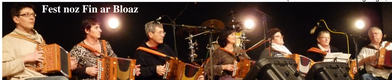
Fest noz Fin ar Bloaz