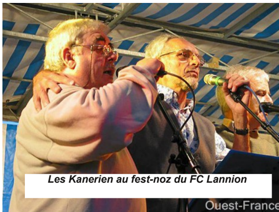
Les Kanerien au fest-noz du FC Lannion