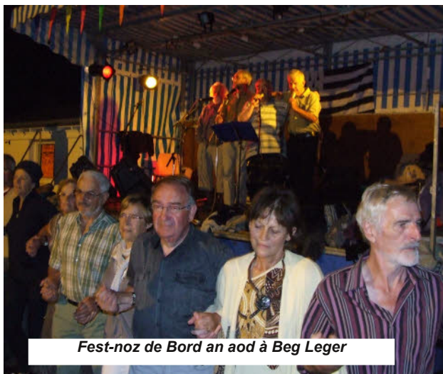
Fest-noz de Bord an aod à Beg Leger

Le groupe a atteint une certaine maturité acquise et entretenue au fil des représentations en "live" et de répétitions quasi-hebdomadaires complémentaires des cours de Sylvain. Maturité jugée suffisante pour aboutir à un "dégroupage" des chanteurs et chanteuses. Le but : accroître le potentiel chants